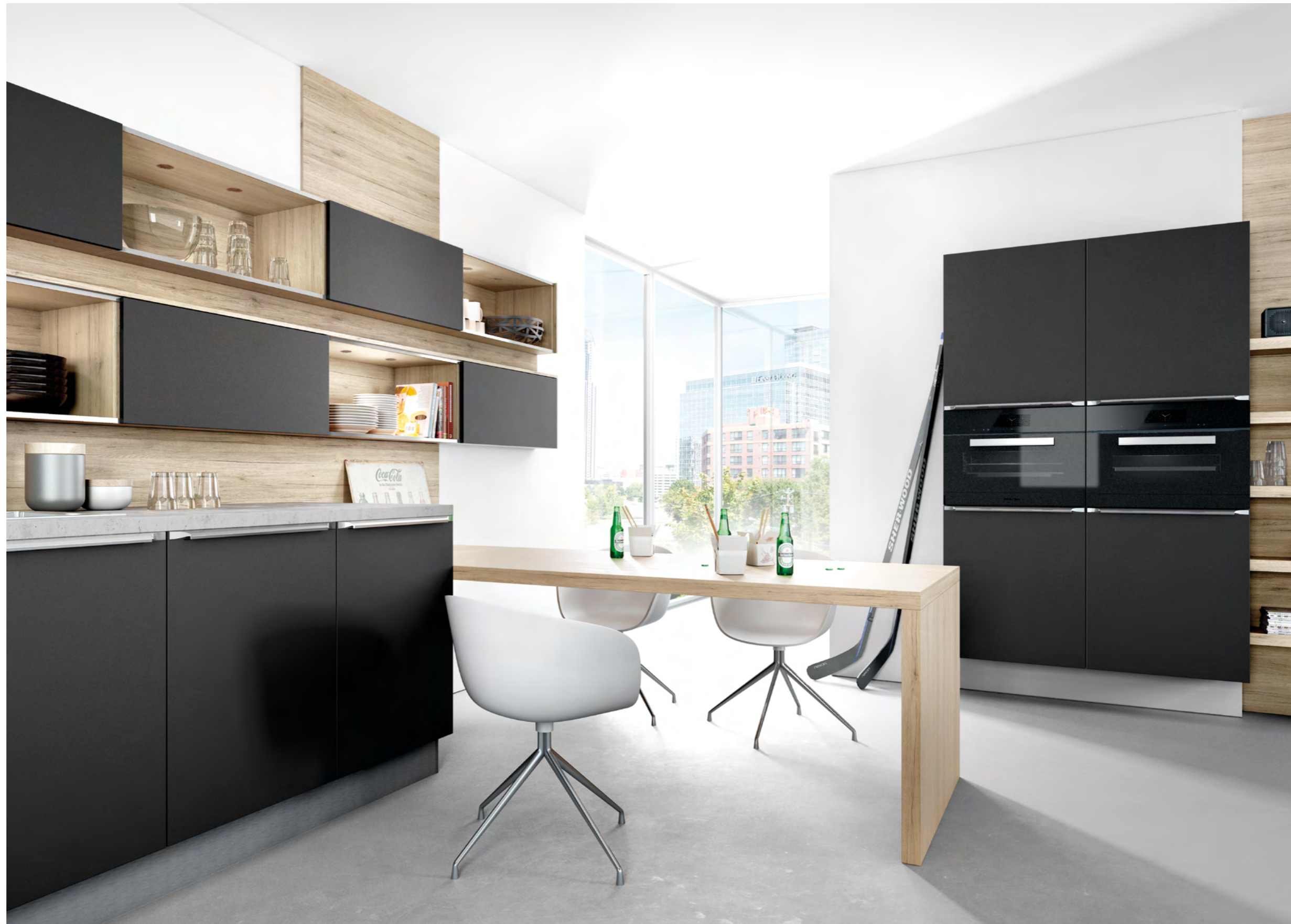
AV 6000 Zwart matlak