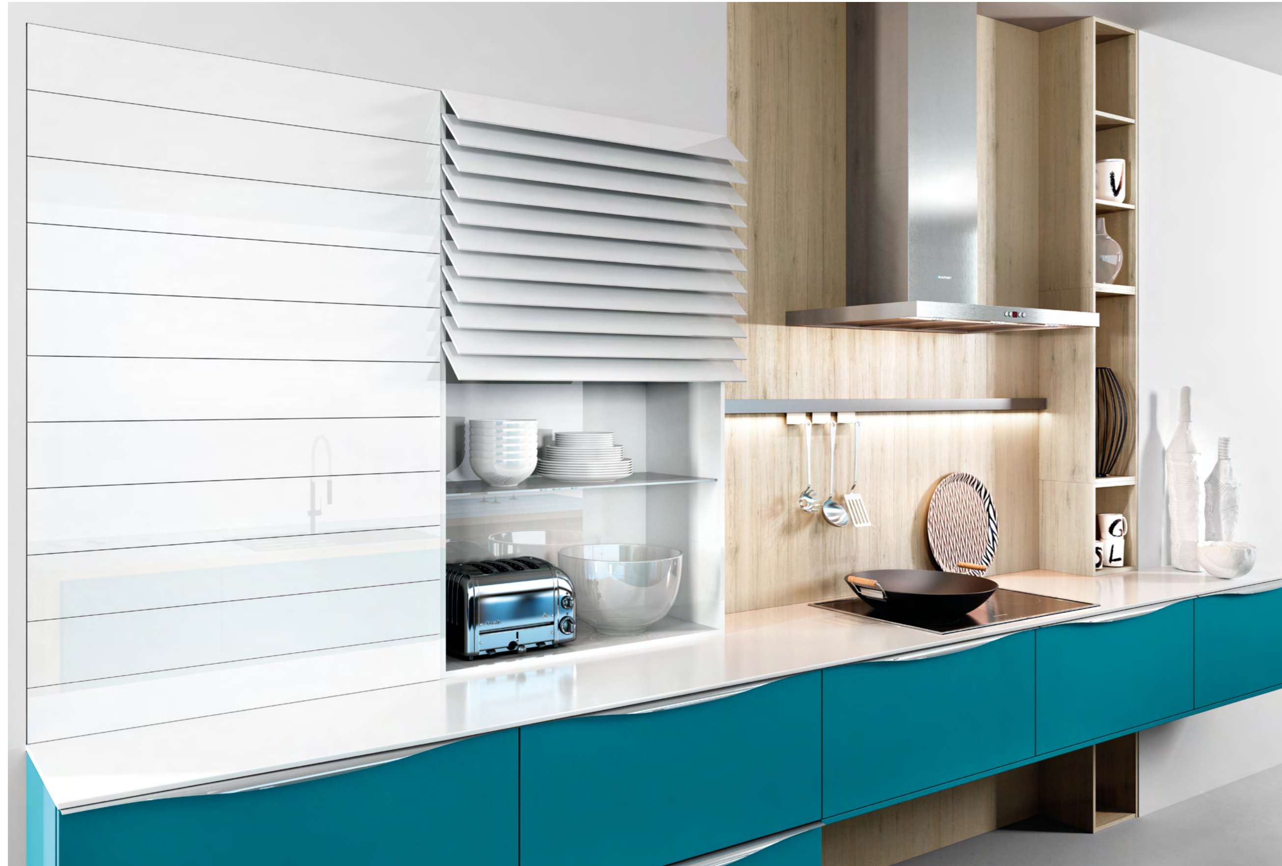
AV 6000 Petrol Mattlack