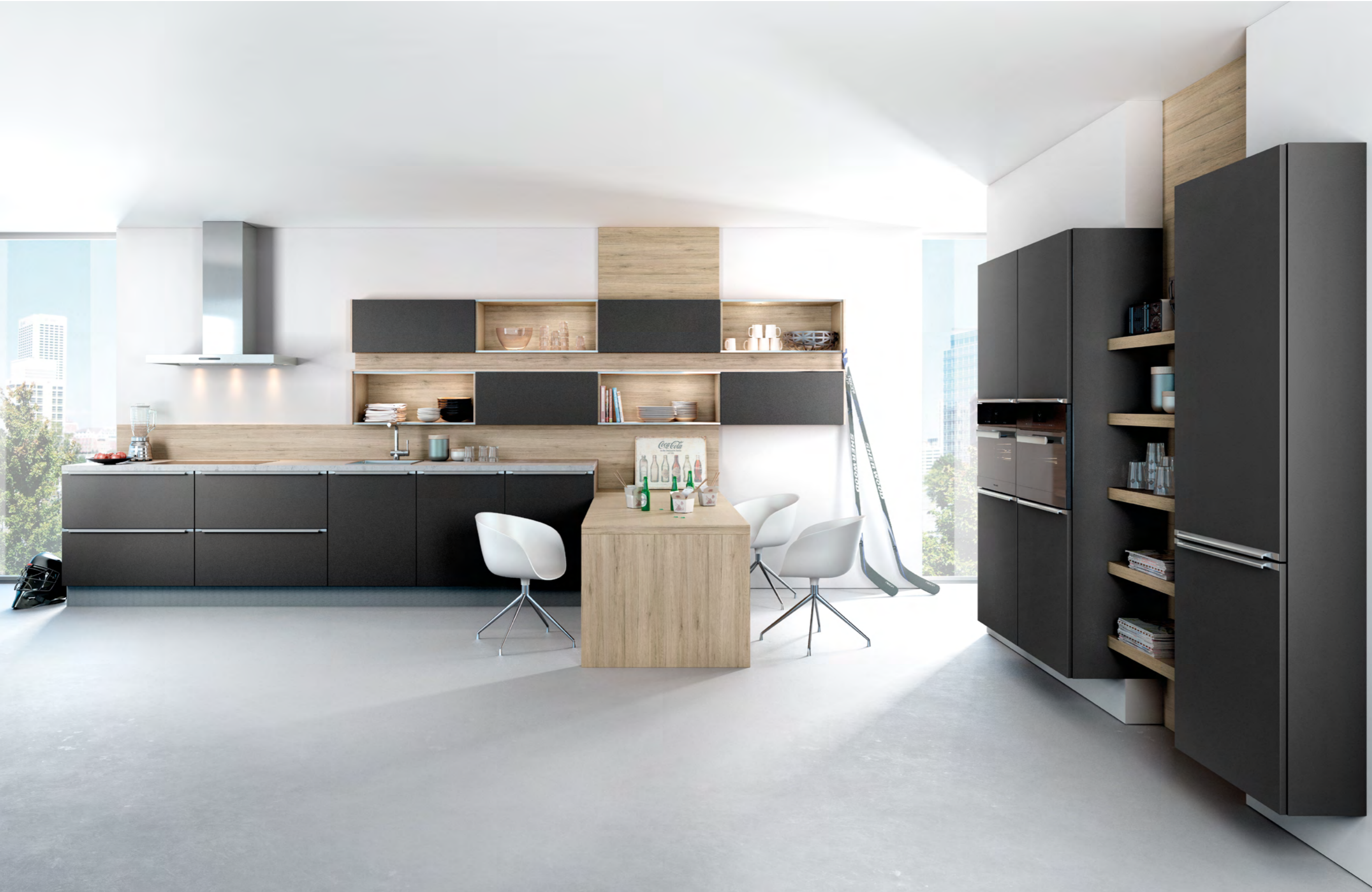
AV 6000 Schwarz Mattlack