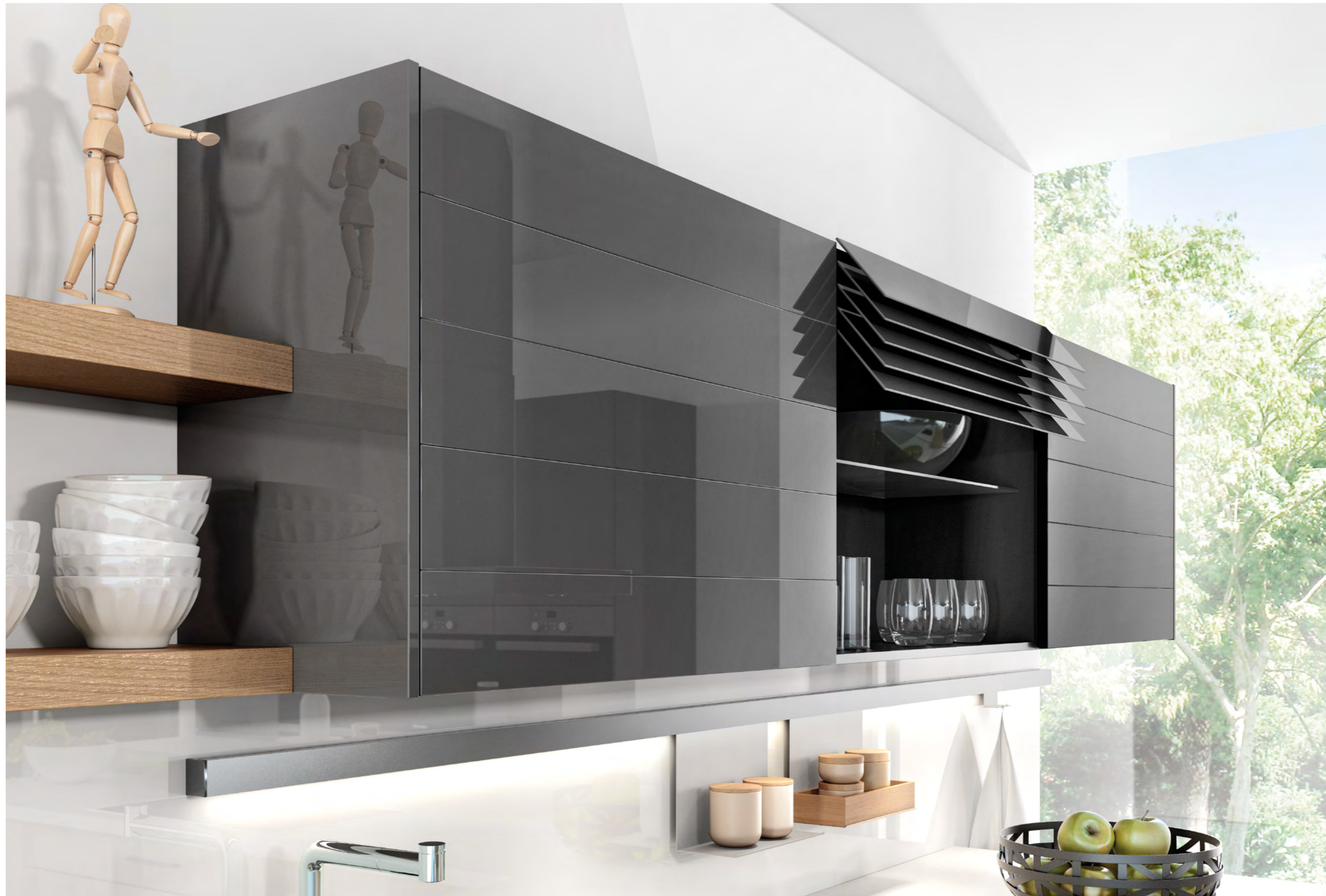
AV 1095 Frêne provence AV 1080 Gris lave