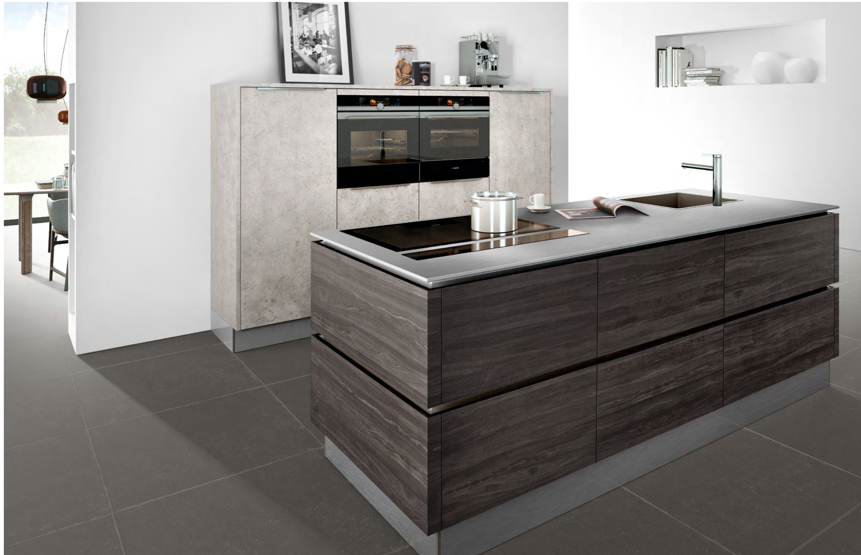
AV 1092 GL Pin foncé AV 2080 Béton naturel