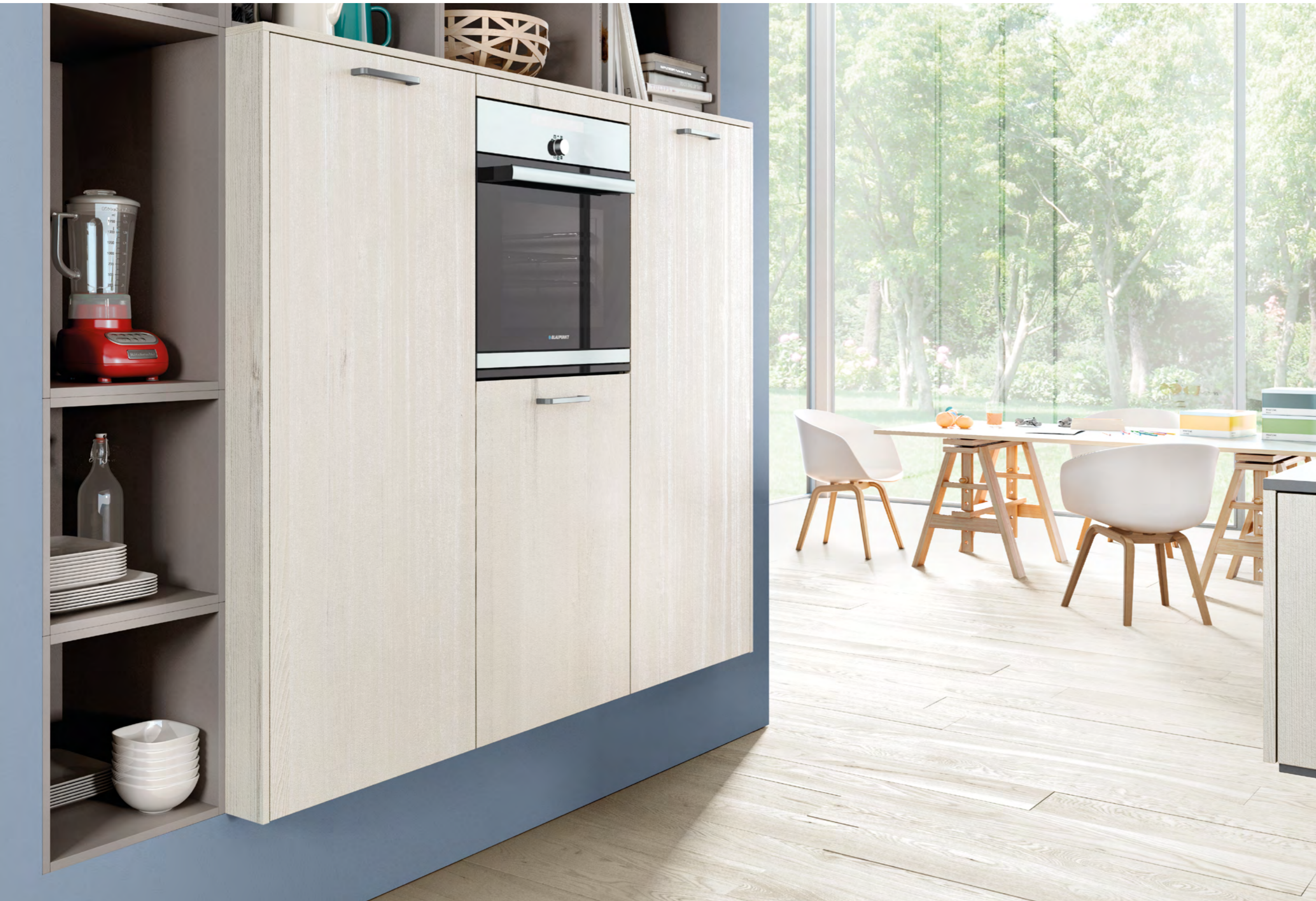
AV 1095 Eiche nordic