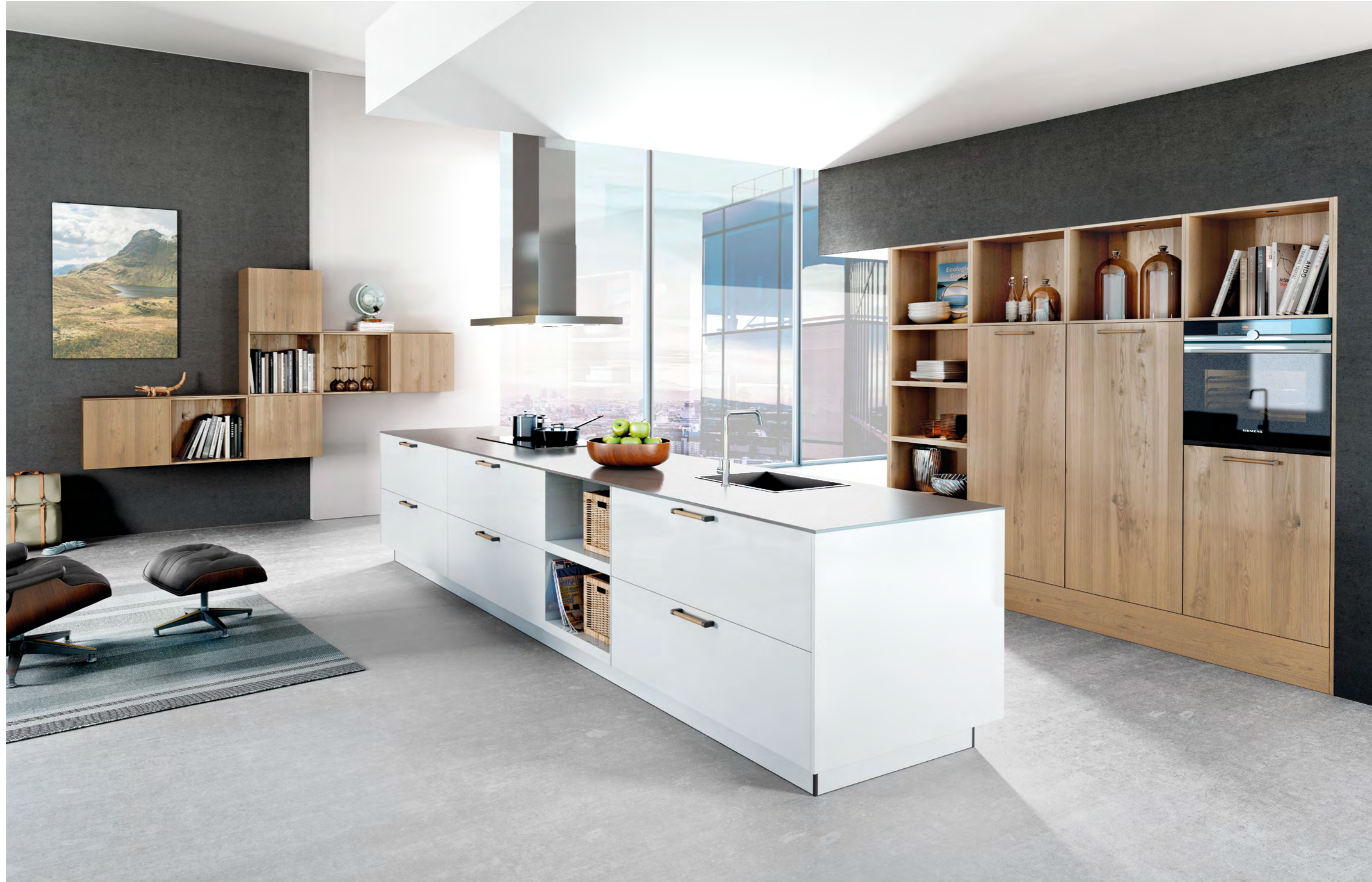
AV 6000 Blanc polaire laque mate AV 5082 Chêne sauv. clair plaqué