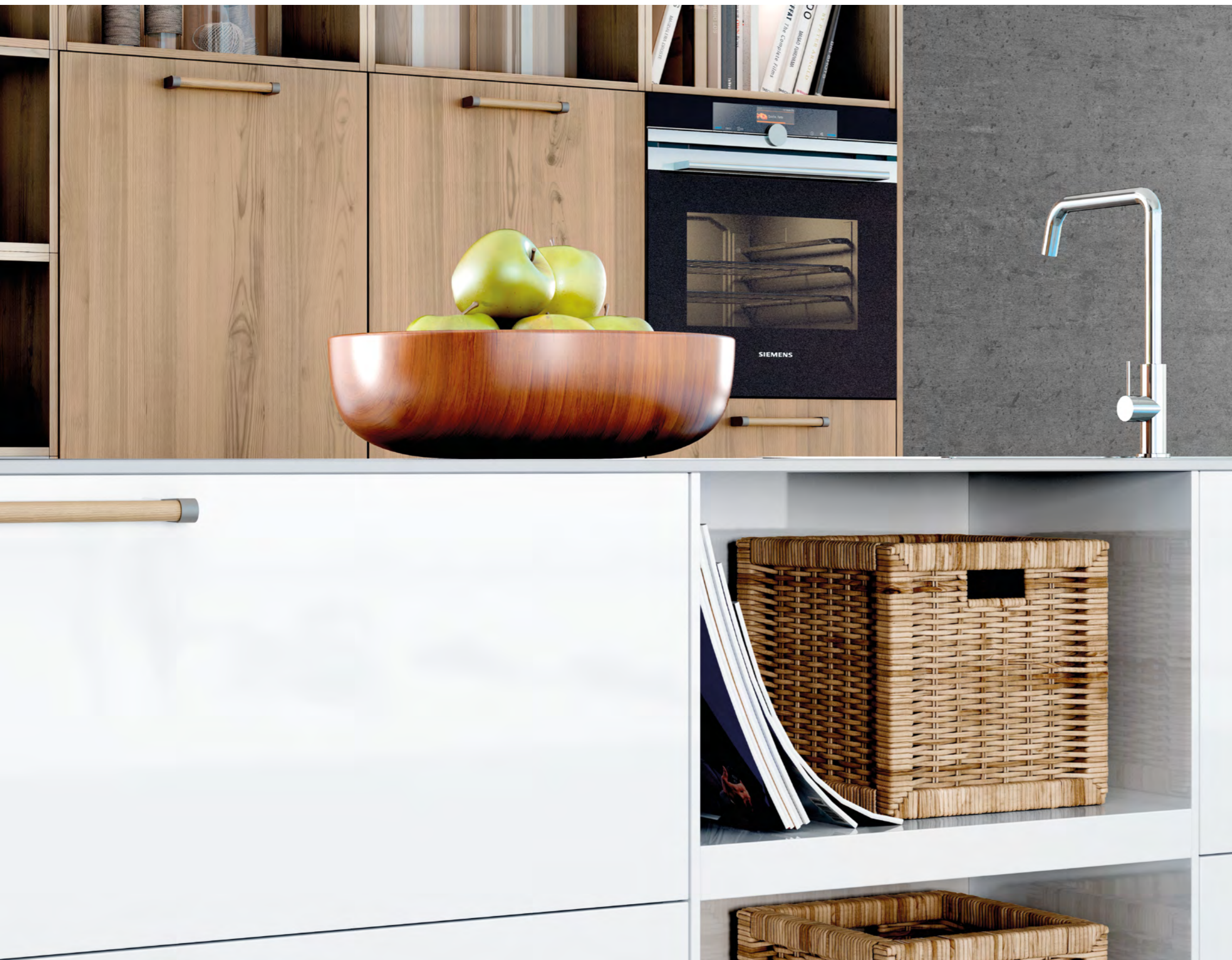
AV 6000 Polarweiß Mattlack AV 5082 Wildeiche-hell Furnier