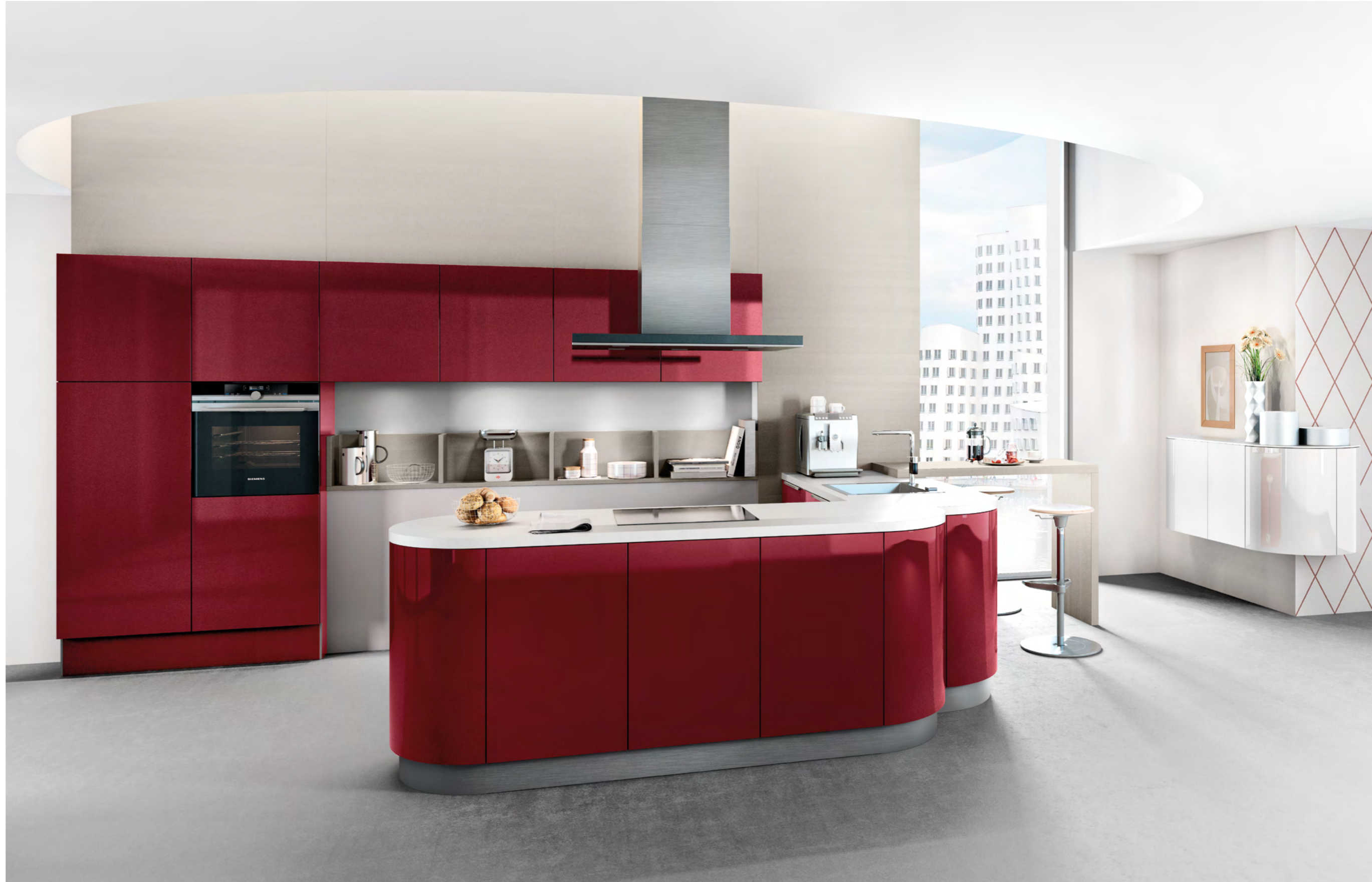
AV 4030 Bordeaux lustre laque AV 4030 Blanc étincelant lustre laque