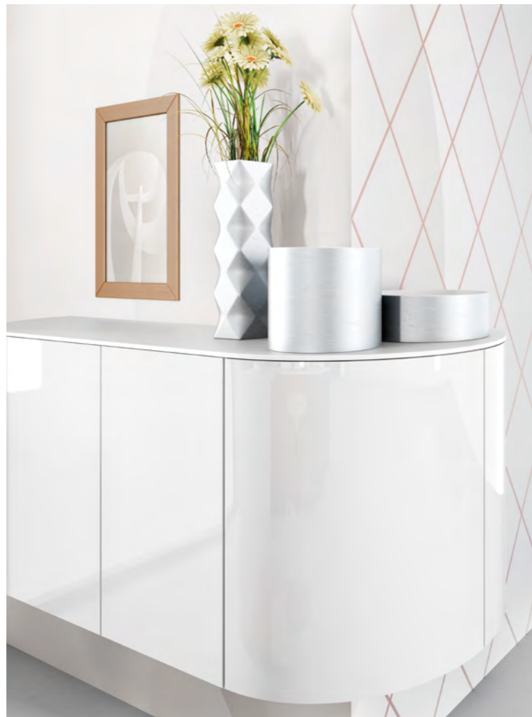
AV 4030 Weinrot Hochglanz Lack AV 4030 Brillantweiß Hochglanz Lack

PL Tylko bez pośpiechu. Kto je śniadanie w spokoju, ma więcej energii, by rozpocząć dzień. O właściwy nastrój zadbać harmonijne kształty i fascynujące kontrasty barwne. W ten sposób kuchnia będzie naprawdę udanym miejscem.