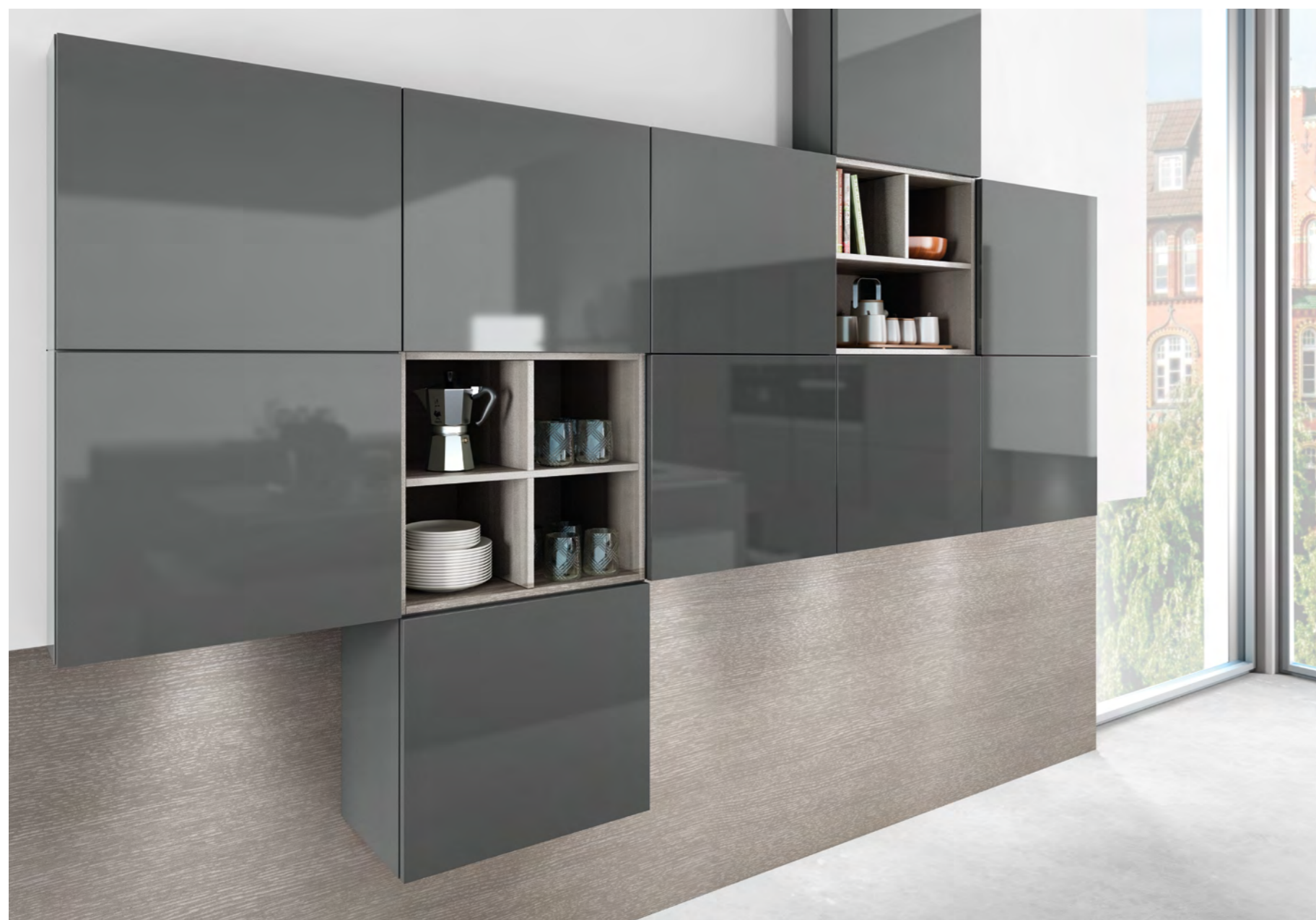
AV 5090 GL Designglas lavagrau

PL Przecież to właśnie w domu jest najpiękniej. Przynajmniej wtedy, gdy wszystko jest doskonale dobrane – od błyszczących ciemnych frontów poprzez wyrafinowane regały, aż po najdrobniejsze detale: pasujące frezowane listwy w kolorze szarej lawy.