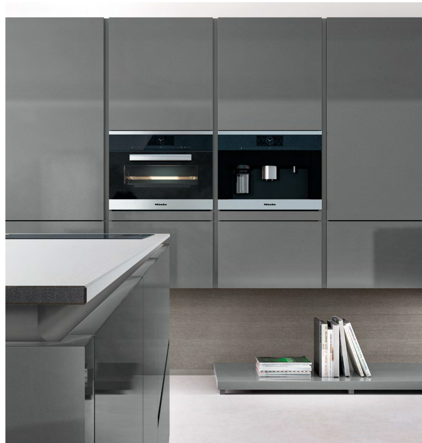
AV 5090 GL Verre design gris lave