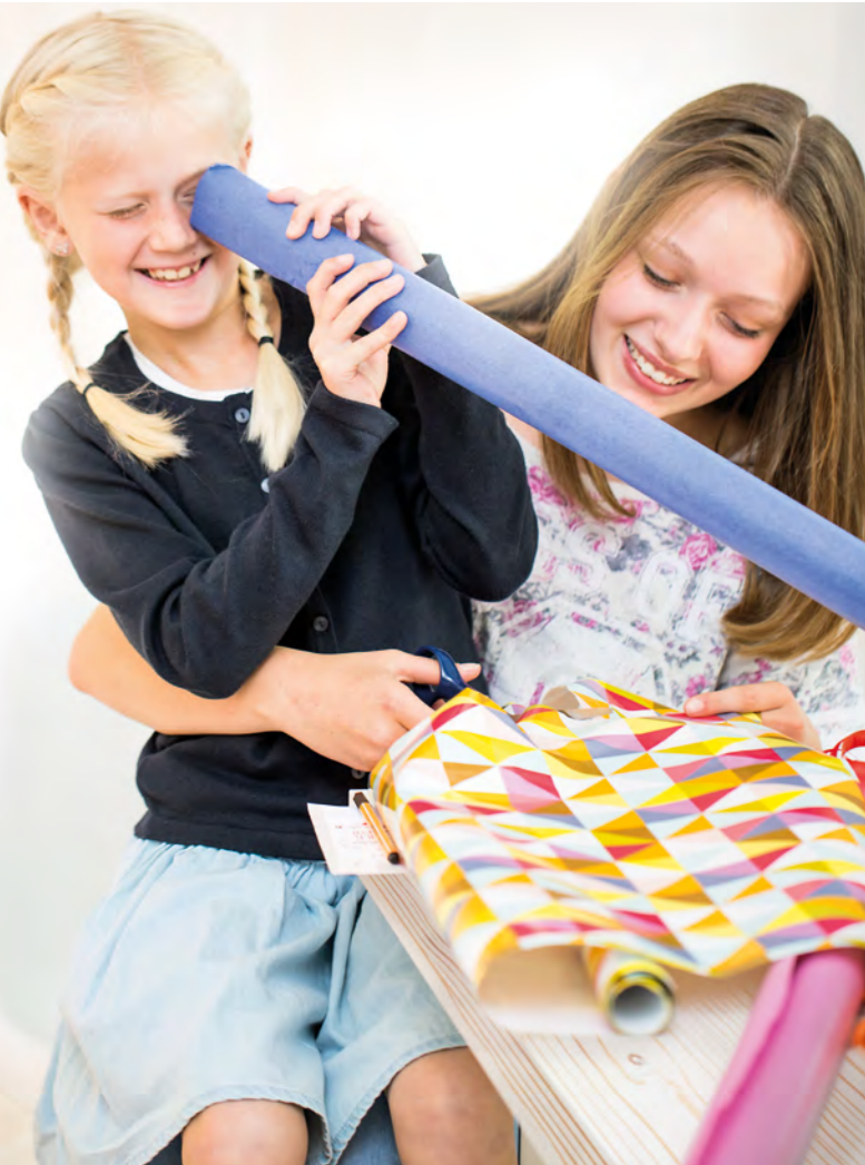
AV 2030 Ozeanblau metallic Hochglanz Lack AV 5083 Pinie-weiß Furnier