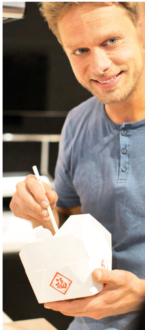
AV 6000 Schwarz Mattlack