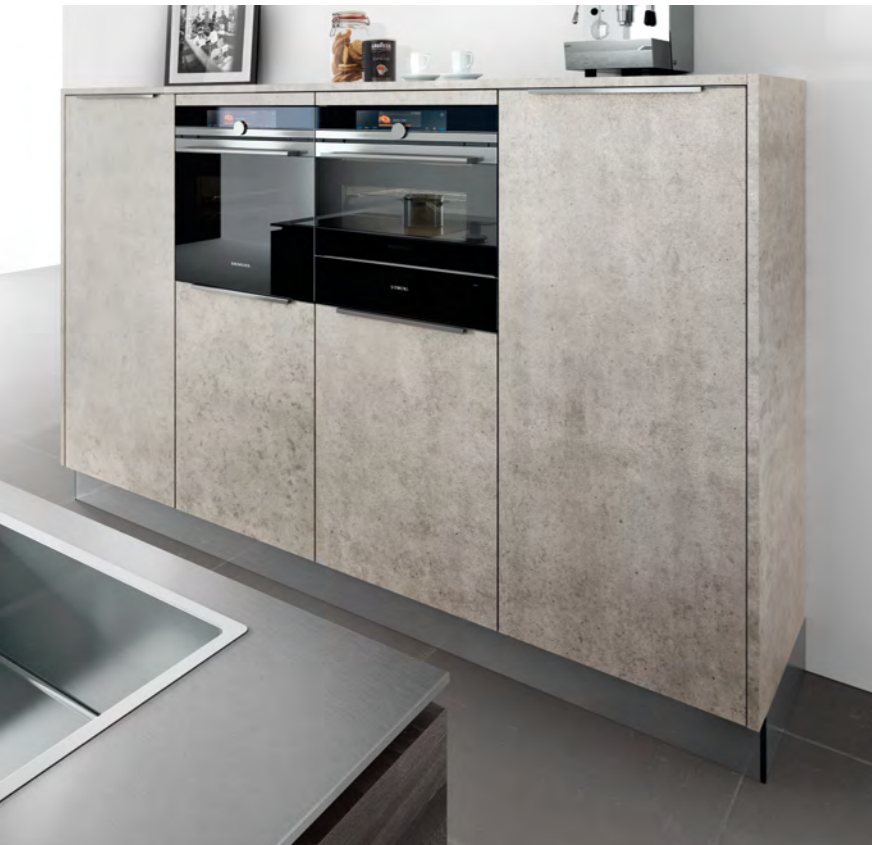
AV 1092 GL Pinie-dunkel AV 2080 Beton-natur