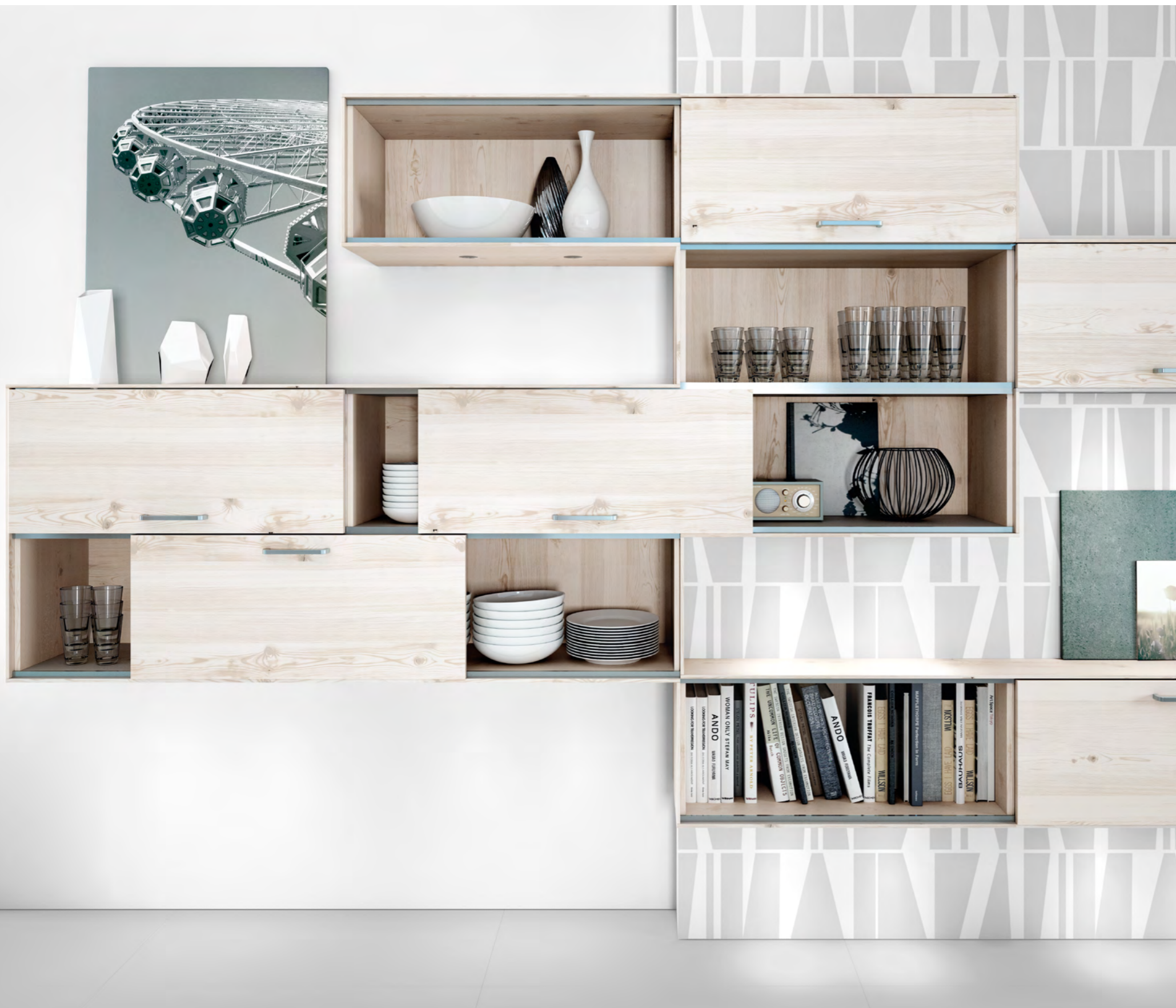
AV 2030 Ozeanblau metallic Hochglanz Lack AV 5083 Pinie-weiß Furnier