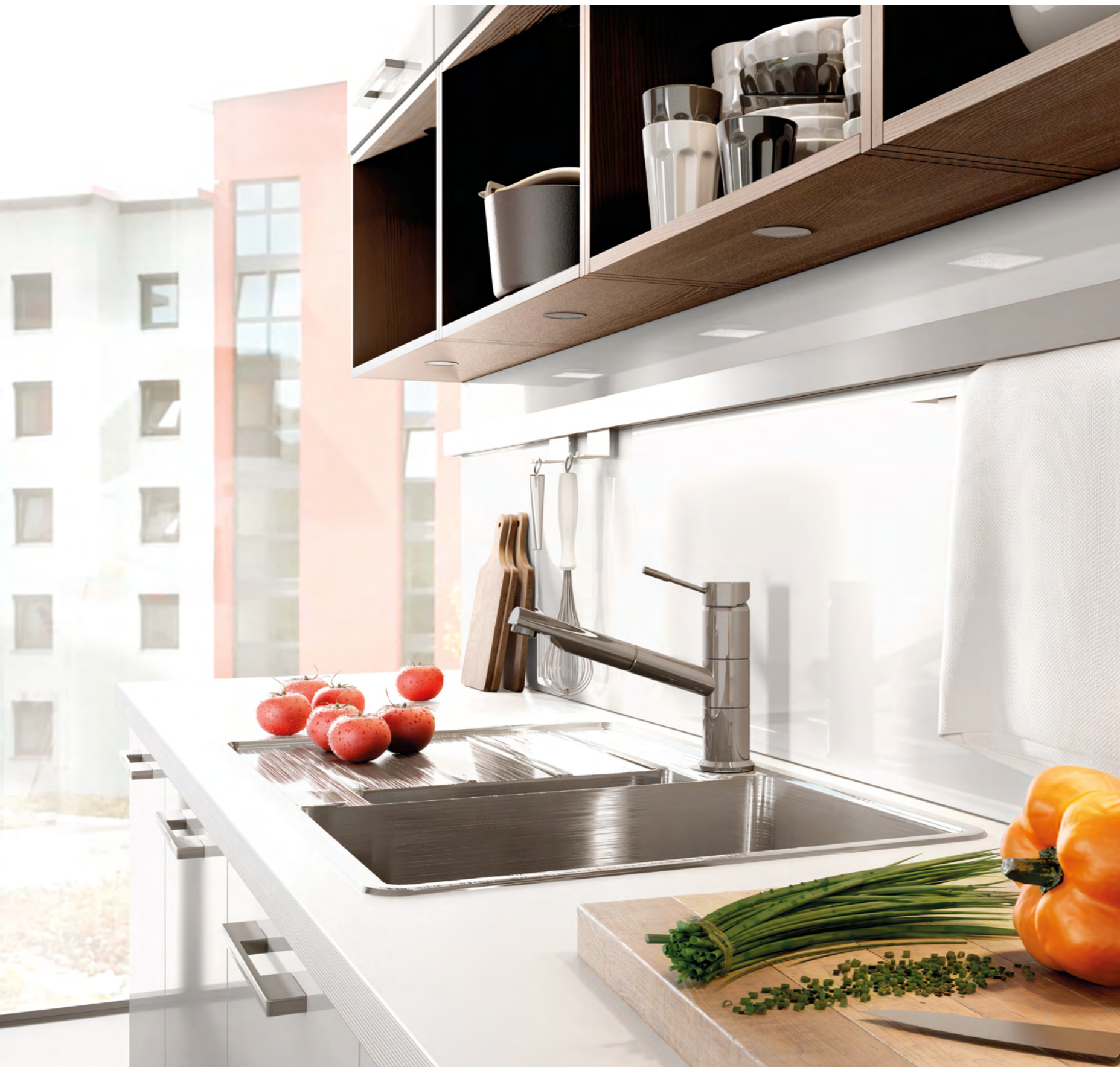
AV 2030 Satin Hochglanz Lack AV 5081 Eiche-sherry geport