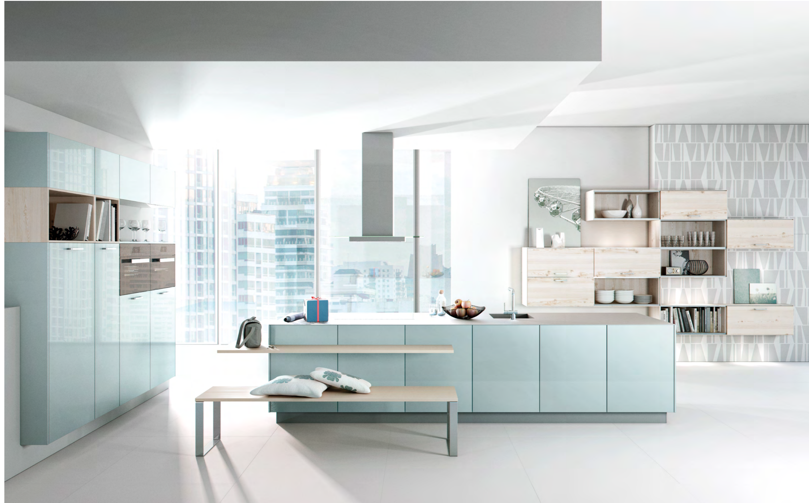
AV 2030 Bleu océan métallisé lustre laque AV 5083 Pin blanc plaqué