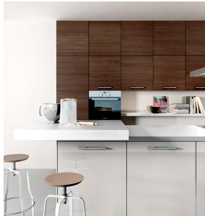
AV 2030 Satin lustre laque AV 5081 Chêne sherry poreux