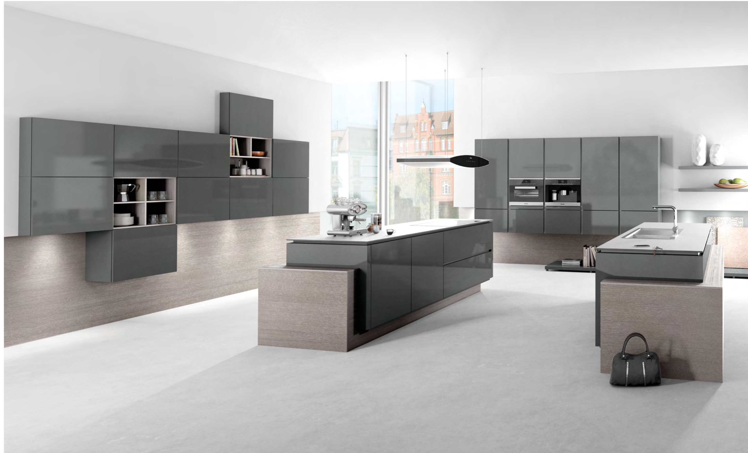
AV 5090 GL Designglas lavagrau