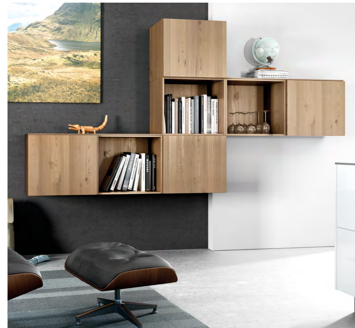
AV 6000 Blanc polaire laque mate AV 5082 Chêne sauv. clair plaqué

D Wer viel unterwegs ist, braucht ein Zuhause, auf das man sich freuen kann. Dank einer offenen Küche mit wohnlicher Atmosphäre. Für gemeinsames Schwelgen in Erinnerungen und Schmieden neuer Pläne für die Zukunft.