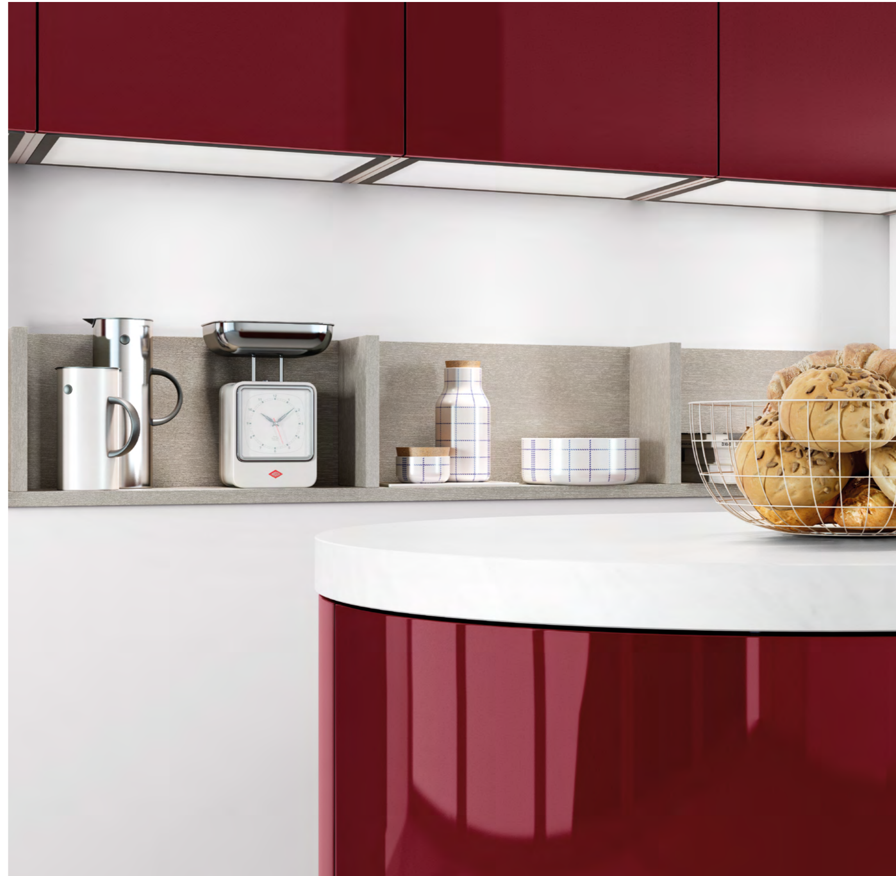
AV 4030 Bordeaux lustre laque AV 4030 Blanc étincelant lustre laque